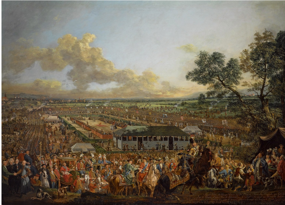
Bernardo Bellotto (Canaletto), Elekcja Stanisława Augusta na Woli , 1776, National Museum in Poznan