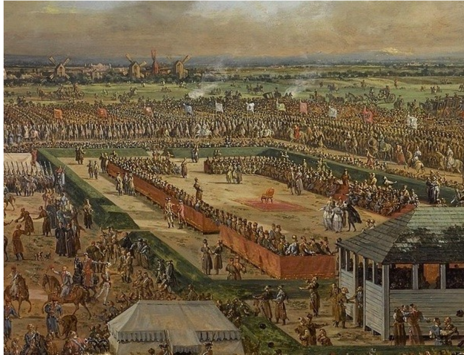
Bernardo Bellotto (Canaletto), Elekcja Stanisława Augusta na Woli , 1776, National Museum in Poznan, detail